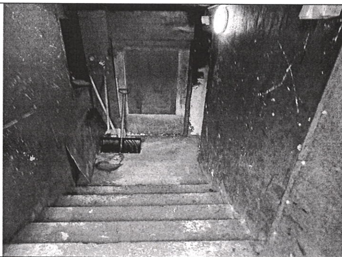
Вход в цокольный этаж