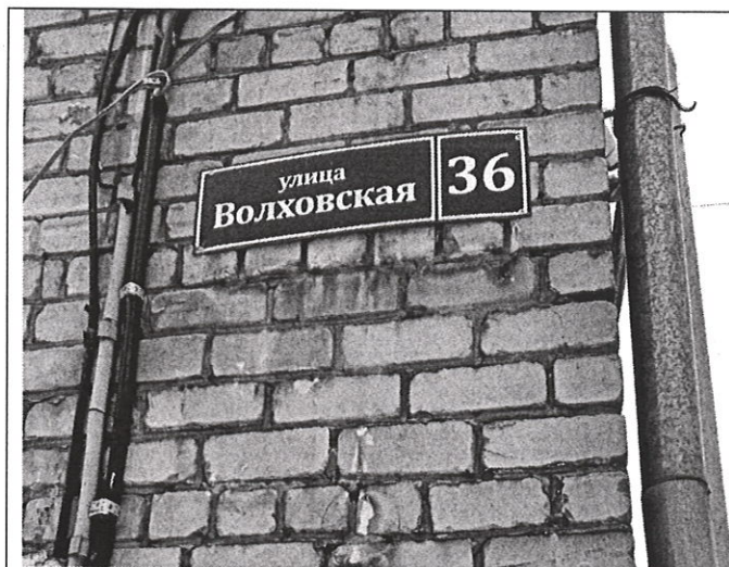
Адресная привязка объекта